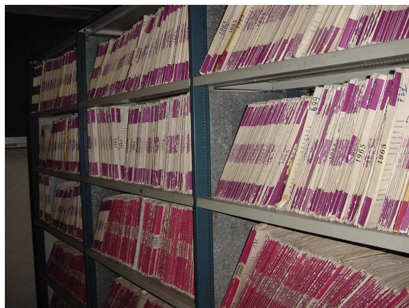
Archivio - La serie delle cartelle cliniche