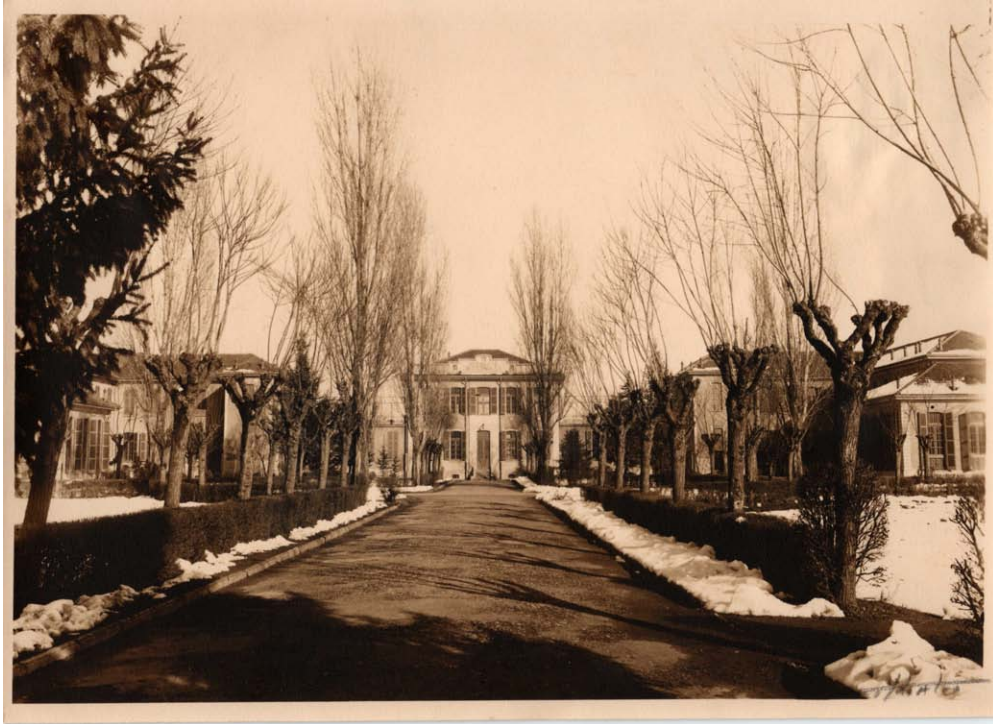
Viale con facciata del padiglione Morselli. Inventario: serie XII, fascicolo n. 1384/11.