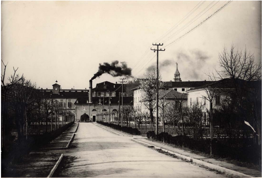
Viale prospiciente la facciata della Sezione Marro. Inventario: serie XII, fascicolo n. 1384/13.