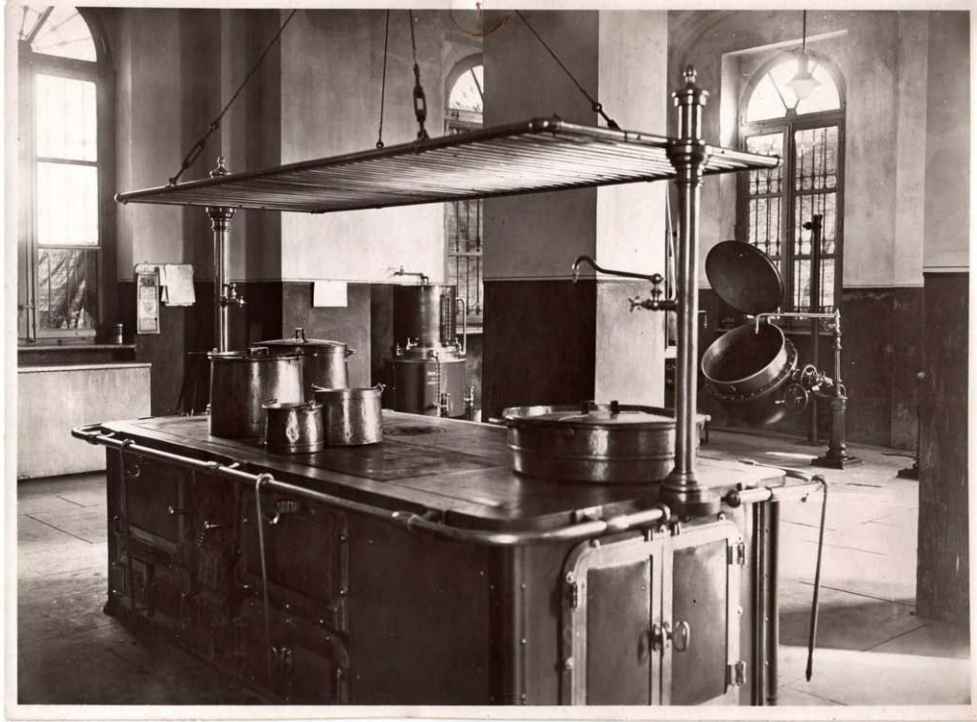
Cucina. Inventario: serie XII, fascicolo n. 1387/3.