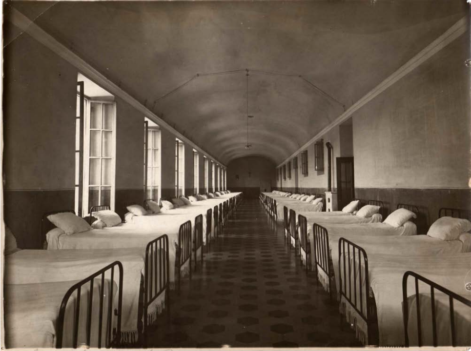
Reparto di degenza, anni '20 del XX secolo. Inventario: serie XII, fascicolo n. 1386/2.