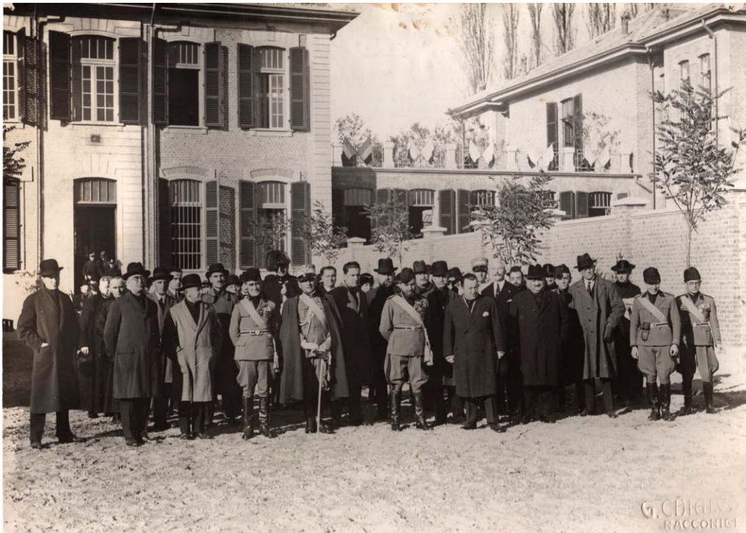
Visita delle autorità, foto di gruppo con personalità politiche e fasciste - Foto Chialvo, post 1922 (Foto Chialvo). Inventario: serie XII, fascicolo n. 1389/1.