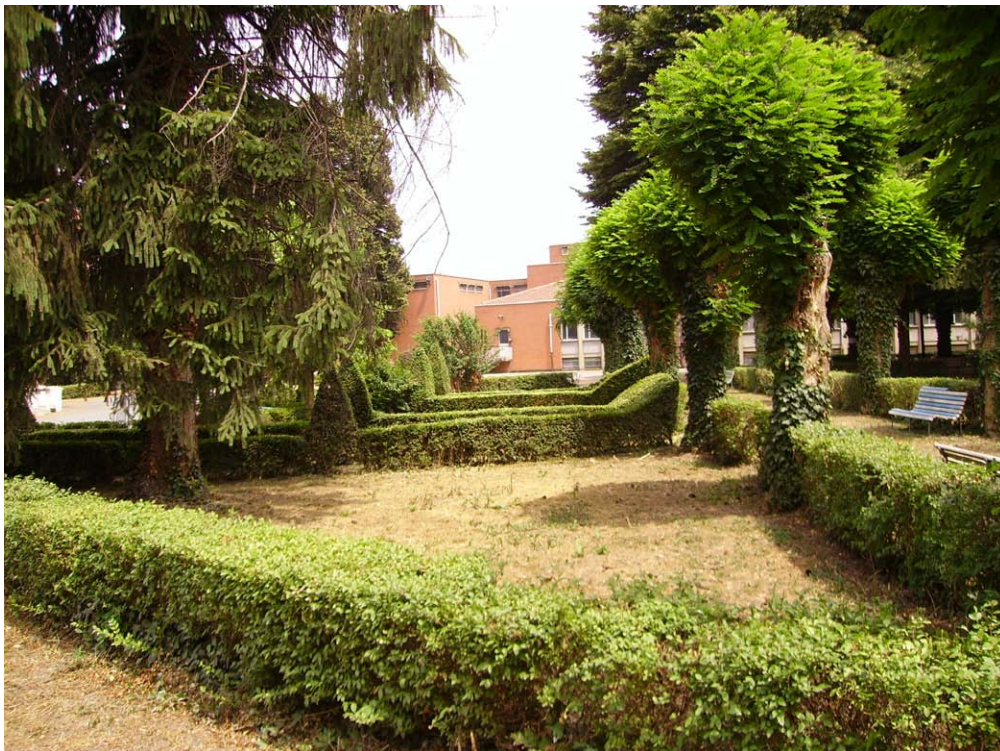
Giardino interno.