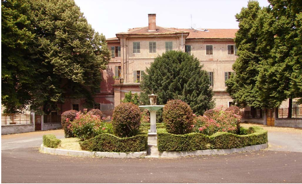
Cortile interno con fontana prospiciente il padiglione Chiarugi (giugno 2006).