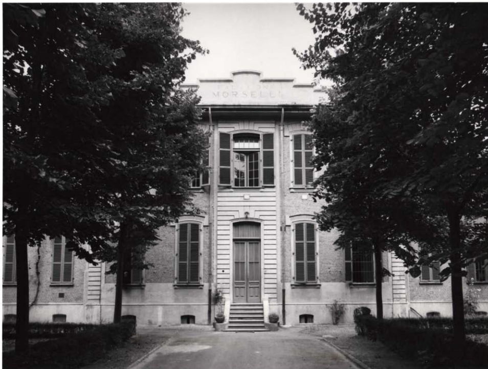
Facciata del padiglione Morselli (Foto Chialvo, luglio 1971). Inventario: serie XII, fascicolo n. 1384/14.