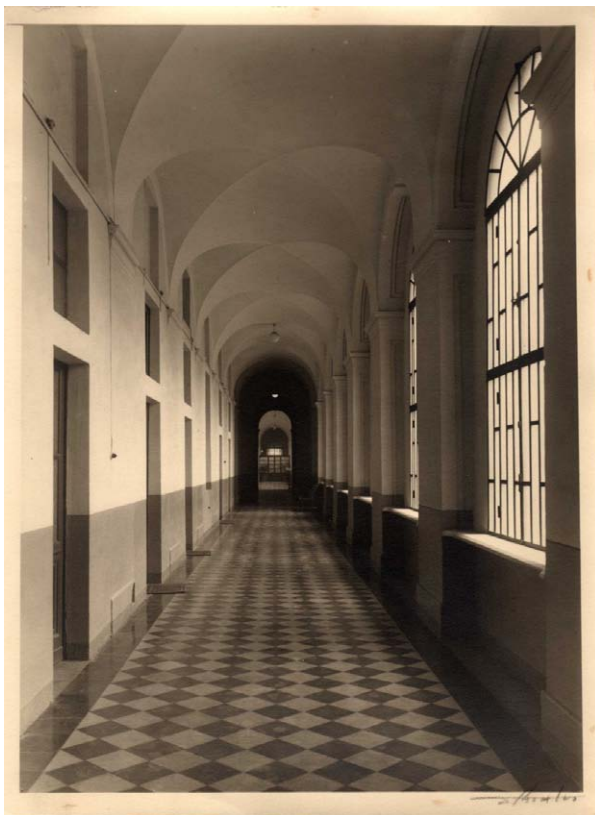
Corridoio di un reparto. Inventario: serie XII, fascicolo n. 1386/1.