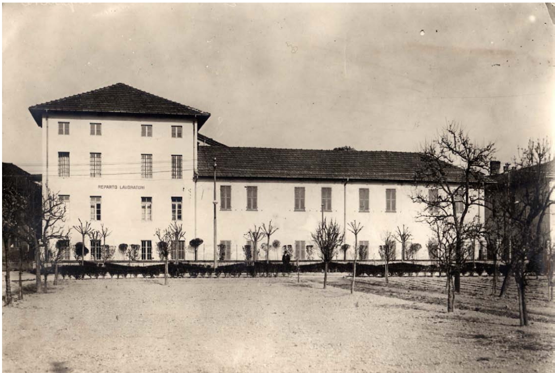
Fabbricato "Reparto Lavoratori", abbattuto per la costruzione del Padiglione Marro, ante anni '40 del XX secolo. Inventario: serie XII, fascicolo n. 1384/4.