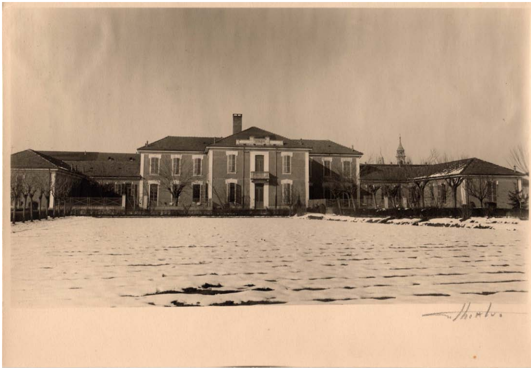
Facciata del padiglione Tamburini. Inventario: serie XII, fascicolo n. 1384/8.