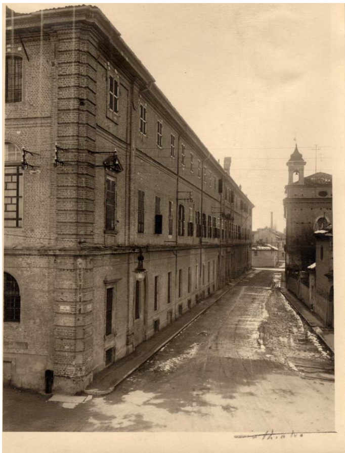
Affaccio del fabbricato dell'ONP su via Ormesano angolo via Lobetto (prima metà XX secolo). Inventario: serie XII, fascicolo n. 1384/12.