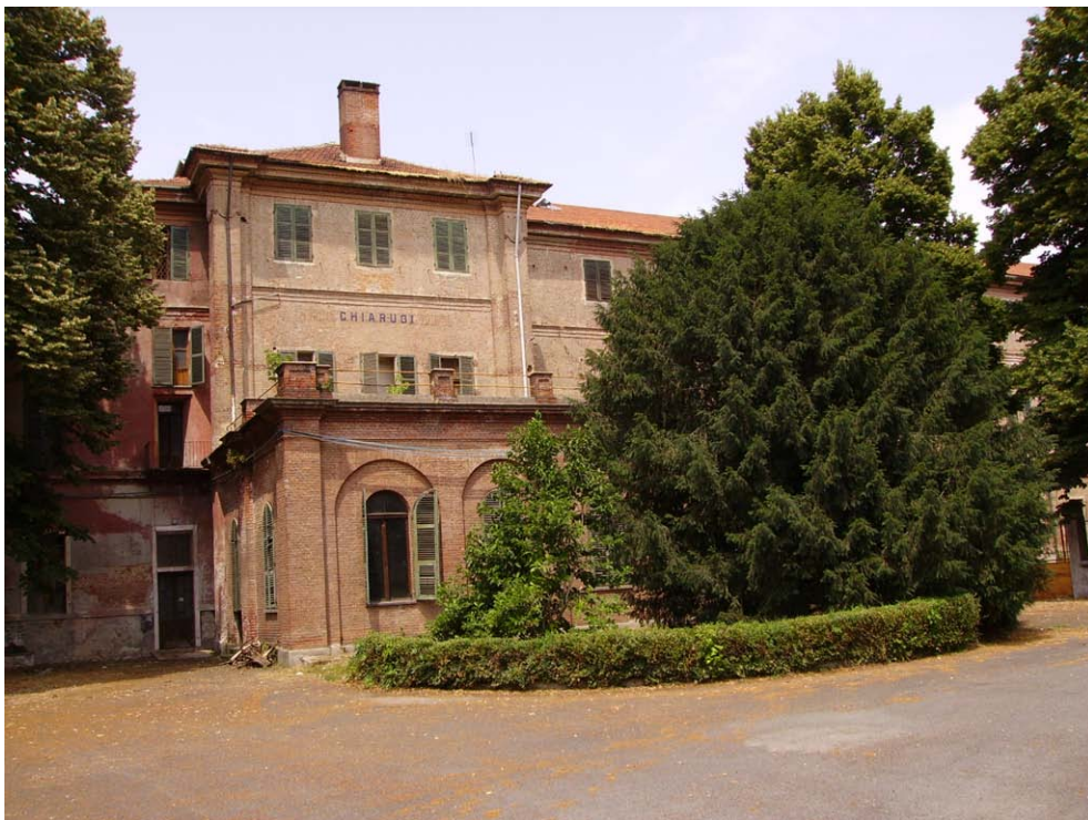
Cortile interno prospiciente il padiglione Chiarugi (giugno 2006).