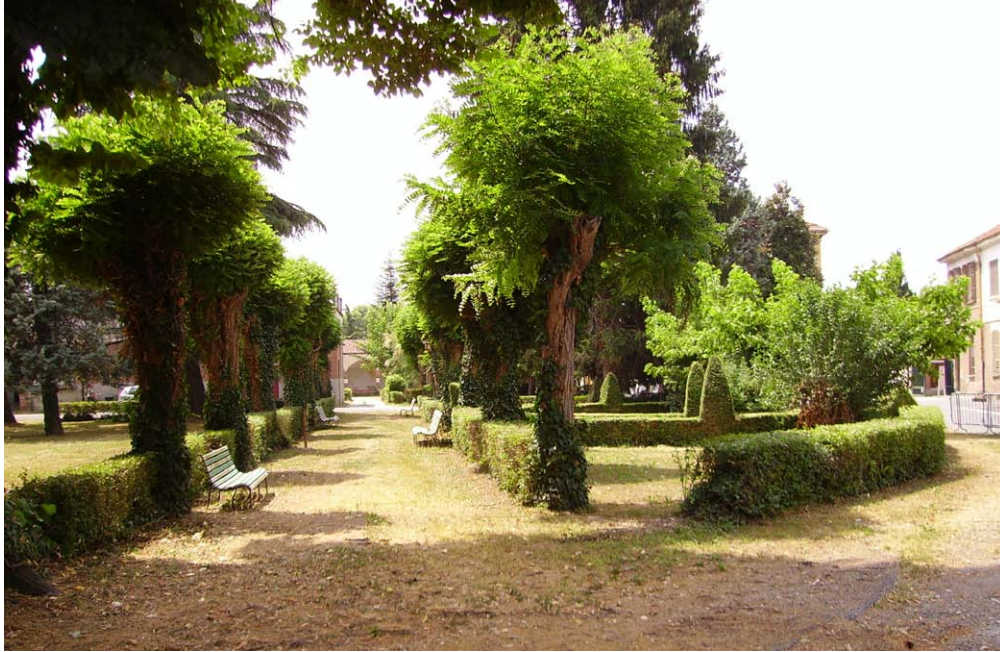
Viale alberato.