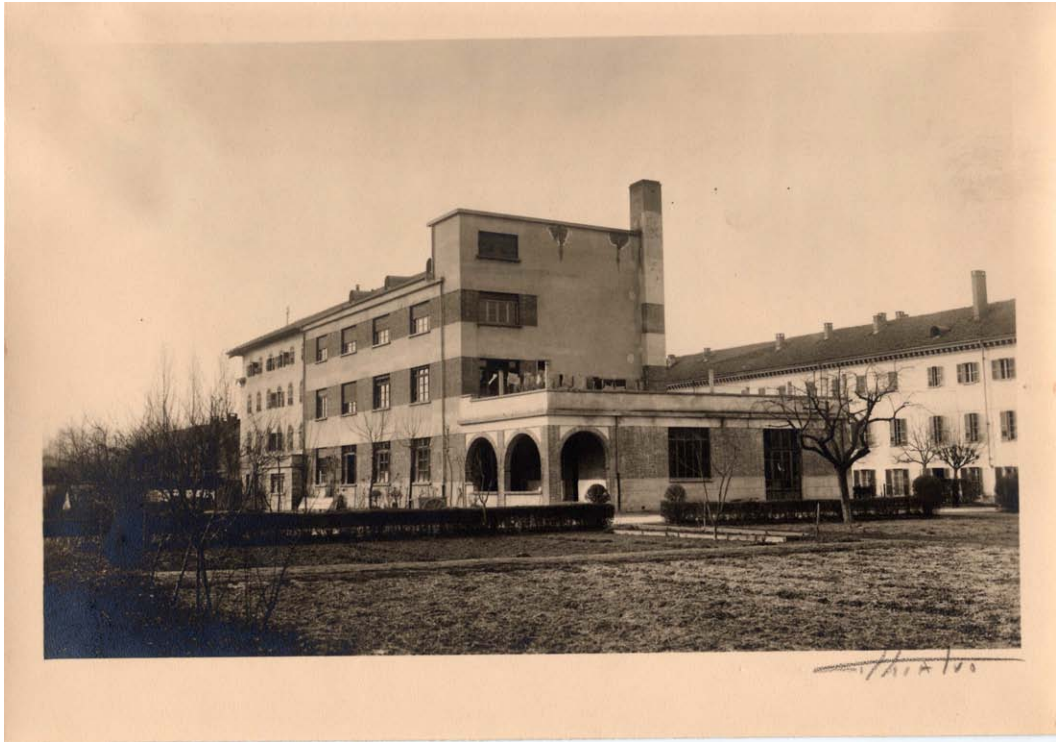
Fabbricato (prima metà XX secolo). Inventario: serie XII, fascicolo n. 1384/5.